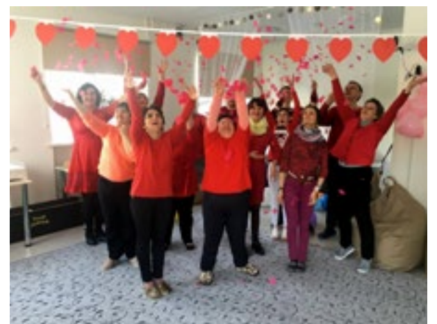
Dienas aprūpes centra košie un priecīgie mīlestības svētku svinētāji