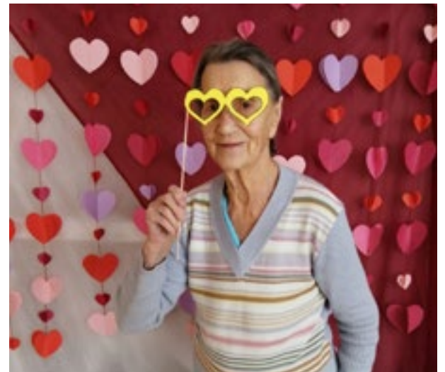
"Caur mīlestības brillēm skatoties, pasaulē ir vairāk prieka" ir pārleicināta SAC "Aglona" iedzīvotāja