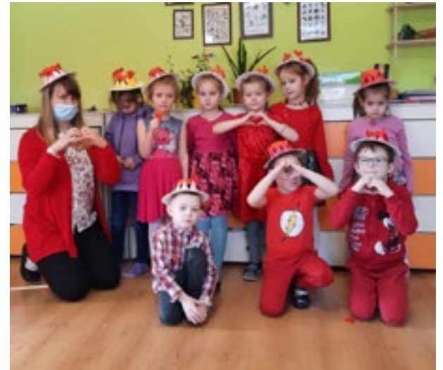
"Dāvinot mīlestību..." Rimicānu PII grupiņa "Bitītes"