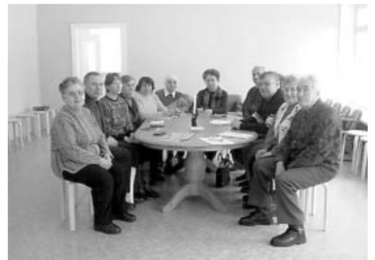
Члены Объединения пенсионеров в новом помещении.

Здоровья, счастья и большой любви Всем женщинам сегодня пожелаем. Ах, если б в марте пели соловьи Или цвела сирень, как в теплом мае. Поздравляем всех женщин с Днем 8 марта!