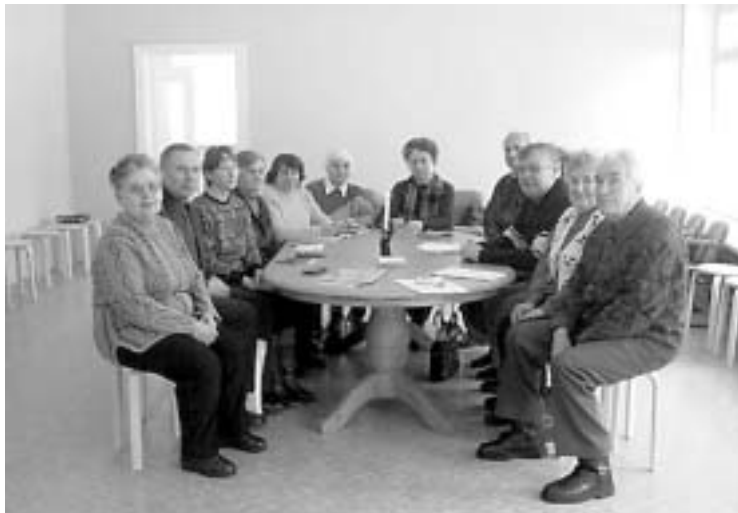
Pensionāru Apvienības biedri jaunajās telpās.