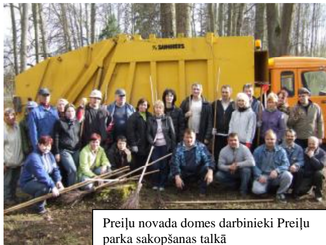
Preiļu novada domes darbinieki Preiļu parka sakopšanas talkā

Preiļu novada dome ir vietējā pārvalde, kas ar pilsoņu vēlētas pārstāvniecības – domes – un tās izveidoto institūciju un iestāžu starpniecību nodrošina likumos noteikto funkciju un pašvaldības brīvprātīgo iniciatīvu izpildi, ievērojot valsts un attiecīgās administratīvās teritorijas iedzīvotāju intereses. Preiļu novada pašvaldība sastāv no