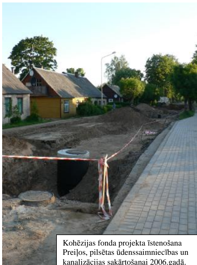
Kohēzijas fonda projekta īstenošana Preiļos, pilsētas ūdenssaimniecības un kanalizācijas sakārtošanai 2006.gadā.

mikroliegumos darbības reglamentē LR likums no 16.03.2000 „Sugu un biotopu aizsardzības likums”, LR MK 30.01.2001 noteikumi Nr. 45 „Mikroliegumu izveidošanas, aizsardzības un apsaimniekošanas noteikumi”.