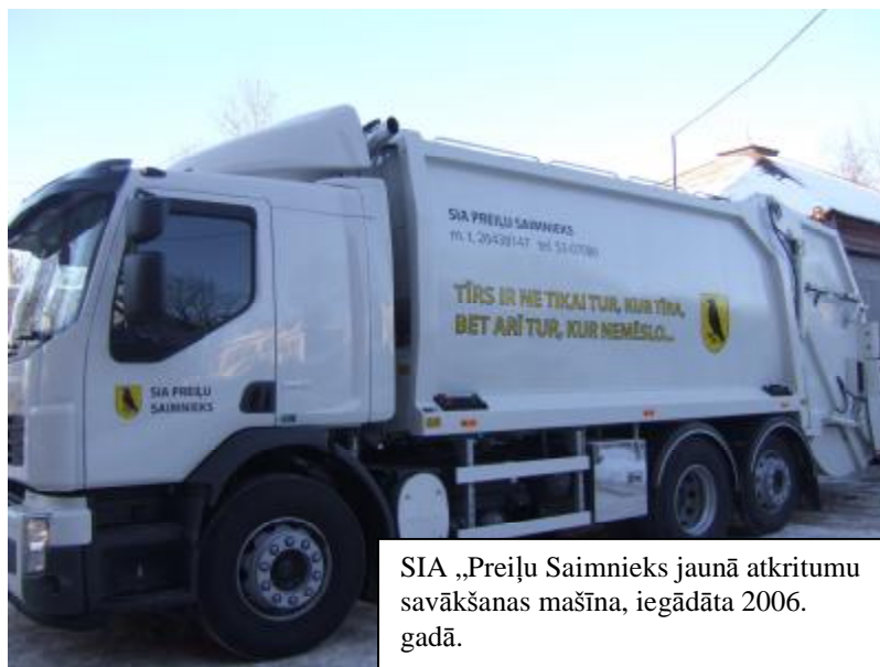
SIA „Preiļu Saimnieks” jaunā atkritumu savākšanas mašīna, iegādāta 2006. gadā.

Līdz ar to tiek noteikti mērķi Vides rīcības programmā , kuri attiecas uz abām EMAS iesaistītajām domes daļām (Administratīvo un Plānošanas daļu):