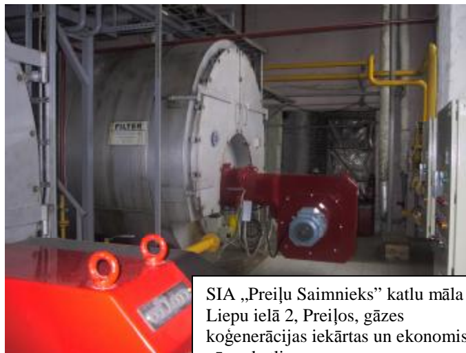
SIA „Preiļu Saimnieks” katlu māla Liepu ielā 2, Preiļos, gāzes koģenerācijas iekārtas un ekonomiskie gāzes katli