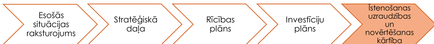
ATTĒLS 1. Preiļu novada attīstības programmas 2022.–2029. gadam struktūra

Attīstības programmas īstenošanas uzraudzības un novērtēšanas kārtība ir viena no piecām plānošanas dokumenta sadaļām (Attēls 1), kas ietver informāciju par uzraudzības sistēmu, uzraudzības rādītājiem, uzraudzības pārskatiem, kā arī attīstības programmas ieviešanas un aktualizēšanas procesu. Uzraudzības sistēma palīdz izvērtēt attīstības programmā plānoto novada attīstību, īstenošanas rezultātus, to iznākumus un ietekmi, kas radīta ilgākā laika griezumā.