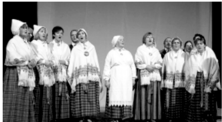
15 ноября самодельные коллективы пригласили всех на концерт Возвращаясь домой в обновленном Прейльском доме культуры.