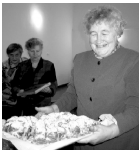
“В нашей жизни столько смысла, сколько мы кому-то можем быть необходимы.” (З.Мауриня.)