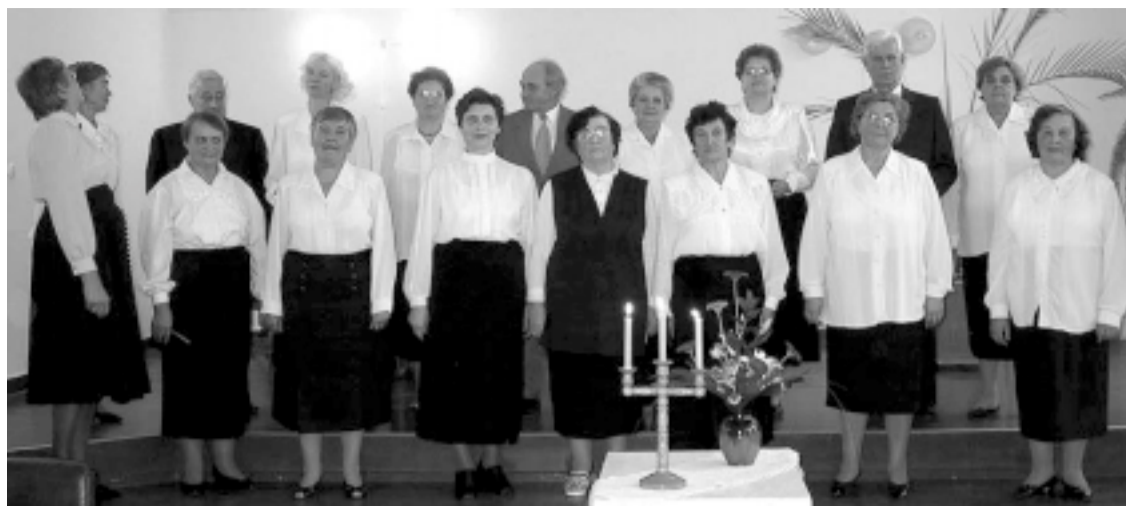
16. novembrī Preiļu pensionāru apvienība aicināja uz divu gadu jubilejas sarīkojumu. Daudz baltu dieniņu tai vēlām arī mēs.