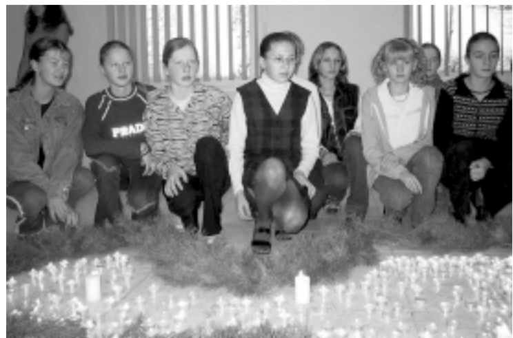
В ожидании государственного праздника Прейльская 1-я основная школа организовала ряд мероприятий Недели Отечества: тематические классные часы, выставку работ школьников, конкурс Создадим Латвию (для 5–6 классов) и торжественное мероприятие для всех учеников, учителей, работников школы.