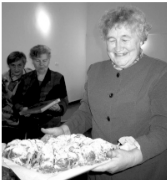
"Mūsu dzīvei ir tik daudz jēgas, cik lielā mērā mēs kādam varam būt nepieciešami." (Z. Mauriņa.)