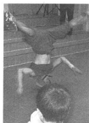
ЛР 2002 года. Младшая группа («С»)