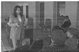
Во время семинара

26 сентября в Социальной службе Прейльской окружной думы прошёл семинар, в котором приняли участие