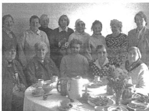
2 октября в центре психологической и социальной помощи «Māstājas» состоялась лекция «Знаешь ли ты Прейли?» для пенсионеров округа.

1 октября - День пожилых людей. Поздравляем всех пожилых людей Прейльского округа! Желаем вам здоровья и энергии!