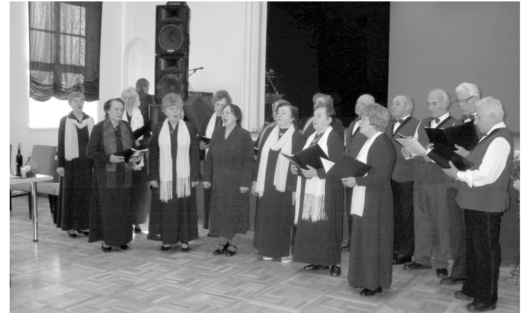
Вокальный ансамбль сениоров поздравляет участников вечера отдыха

Веру в успешную деятельность правления придает то, что