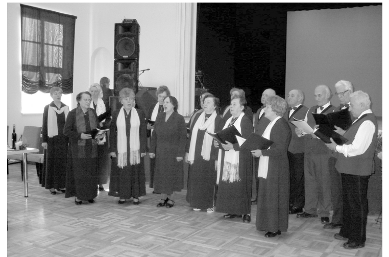
Senioru vokālais ansamblis sveic atpūtas pasākuma dalībniekus

Tiķību valdes sekmīgai darbībai vieš tas, ka PA četru gadu darbības laikā ir izveidojies stabils aktīvistu kolektīvs, kas nesav-