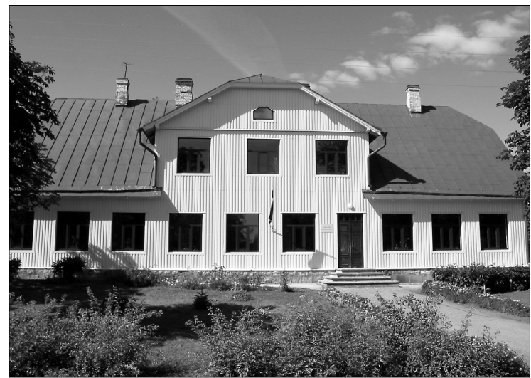
Tāda šobrīd izskatās atjaunotā Aizkalnes pamatskolas ēkas fasāde

rētajiem skolas remontdarbiem un iesaistīšanos jaunos projektos. Skola šobrīd izjūt pedagogu trūkumu, tāpēc ir doma nodibināt stipendiju, lai varētu atbalstīt jauniešus, kuri vēlas atgriezties strādāt Preiļos.