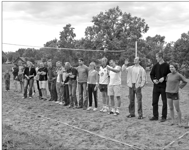
Команды к старту готовы

С каждым годом количество участников возрастает, и желание участвовать в соревнованиях выражают команды соседних районов. Команды других районов на чемпионате округа могли участвовать только по приглашению организаторов. Вместе в соревнованиях приняло участие 11 команд из Прейльского округа, Рушоны, Ливан и Абельской волости Екабпилского района. Команды были разделены на две подгруппы и игры проводились по одному кругу. Две лучших команды из каждой подгруппы продолжали борьбу за призовые места. В игре