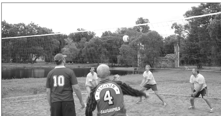
Preiļu novada 2005. gada pludmales volejbola čempionāts