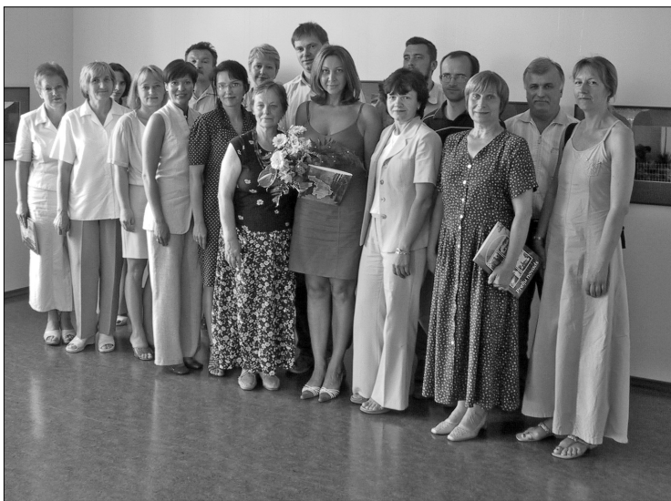
Рабочая группа проекта и партнеры по сотрудничеству

В июле закончился проект «Реконструкция Прейльского замка и парка для создания Делового центра», финансируемый программой PHARE ЕС. Чтобы реставрировать замок и благоустроить парк, разработан план маркетинга и инвестиций, а также технический проект реконструкции замка и парка.