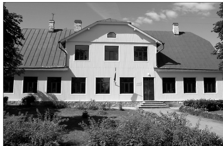
Таким выглядит здание Айзкалнской основной школы сегодня