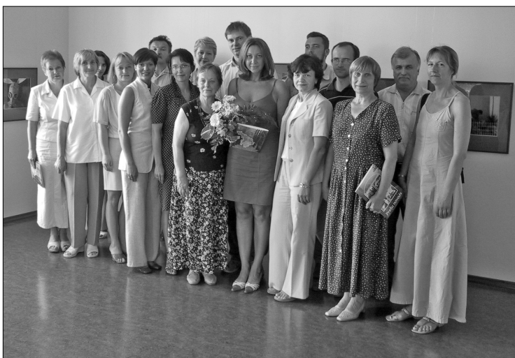
Projekta darba grupa un sadarbības partneri

Jūlijā noslēdzās Eiropas Savienības PHARE programmas finansētais projekts «Preiļu pils un parka rekonstrukcija Darījumu centra izveidei». Lai restaurētu pili un labiekārtotu parku, izstrādāts mārketinga un investīciju plāns, pils un parka rekonstrukcijas tehniskais projekts.