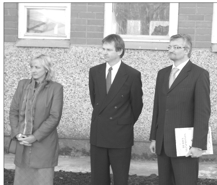
Preiļu PII “Pasaciņa” filiāles “Auseklītis” atklāšanas notikumiem lūdzi sekoja (no kreisās) 8. Saeimas deputāte Elita Šņepste, domes priekšsēdētājs Jānis Eglītis un bērnu un ģimenes lietu ministrs Ainars Baštiks.

Ēdiens bērniem tiks gatavots “Pasaciņā” un no turienes trīsreiz dienā tiks vests uz “Auseklītī”. Šim nolūkam ir iegādāti speciāli termosi, dome nodrošinās transportu vešanai. Pirmsskolas izglītības iestādē “Pasaciņa” no-