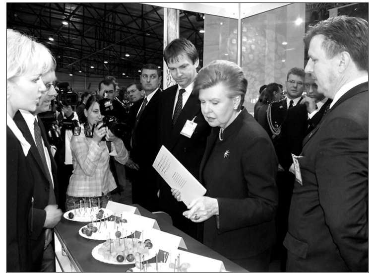
Президент государства Вайра –Вике Фрейберга знакомится с продукцией а/о «Прейлю сьерс».

В день открытия выставки с размещённой продукцией а/о «Прейлю сьерс» познакоми-