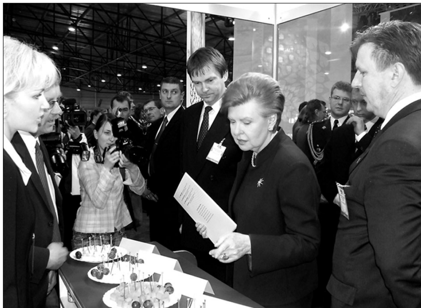
Valsts prezidente Vaira Vīķe-Freiberga izstādē izteica gandarījumu par a/s „Preiļu siers” attīstību

Izstādes atklāšanas dienā ar a/s „Preiļu siers” izvietoto produkciju iepazīs Latvijas Valsts prezidente Vaira