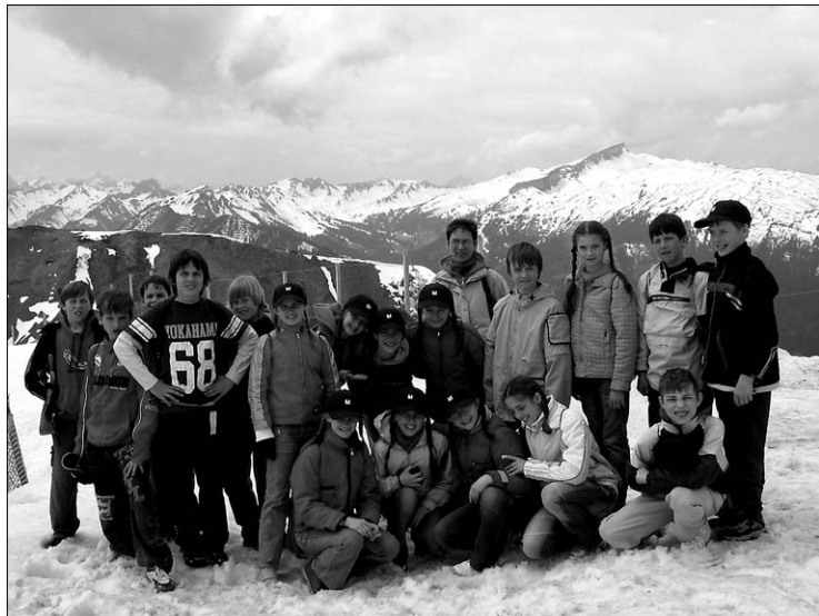
Коллектив 5-6 классов Прейльской средней школы №1 на высоте 2037 метров горы Фелберга