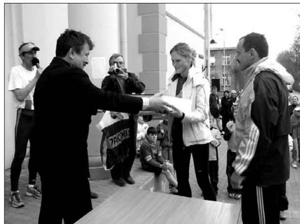
Balvas saņem ģimeņu skrējiena komanda „Linu pogaļiņas”

2. maijā Preiļu pilsētas ielās notika kārtējais stafesu skrējienis un ģimeņu skrējienis. Sacensībās piedalījās aptuveni 500 dalībnieku, pārstāvētas bija dažādas vecuma grupas.