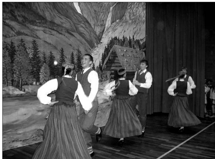
Танцоры удивляют местных жителей художественным исполнением и аттрактивностью