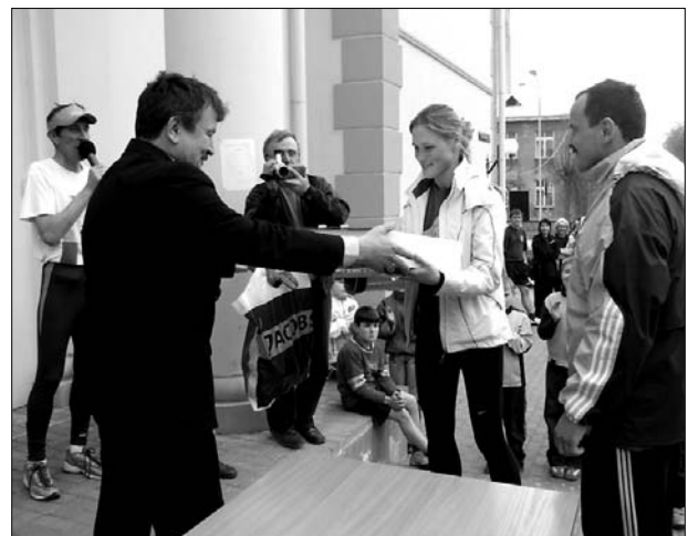
Награду получает команда семейного забега «Лину погалиняс»

2 мая на улицах города Прейли проходил очередной забег с эстафетами и семейный забег. В соревновании участвовало примерно 500 участников, представляющих различные возрастные группы. В группе 2-3 классов 1 место занял 3с класс Прейльской основной школы №1 (4.04). На 2 месте 2с класс Прейльской основной школы №1(4.22), третья- 1 класс Прейльской средней школы №2 (4.38). Между 4-5 классами лавры победителей поделили команды 5с,5а и 5в классов. В группе 6-7 классов победили команды Прейльской средней школы №1-7е(3.16), 7в (3.23) и 6с (3.24) Среди 8-9 классов 1 место занял 9а Прейльской основной школы №1 (2.55), 2 место-9с Прейльской основной школы №1 (2.57), 3 место-9в Прейльской основной школы №1(2.59). Из 4 команд 10-12 классов 1 место в забеге-2 курс Прейльской Государственной гимназии (2.54), 2 место- Прейльская средняя школа №2 (2.57), 3 место -1 курс Прейльской Государственной гимназии (2.58). Во взрослой группе непобедимыми остались спортсмены полицейского управления Прейльского района (3.07), 2 место-команда а/о «Прейлю сьерс» (3.12), на 3