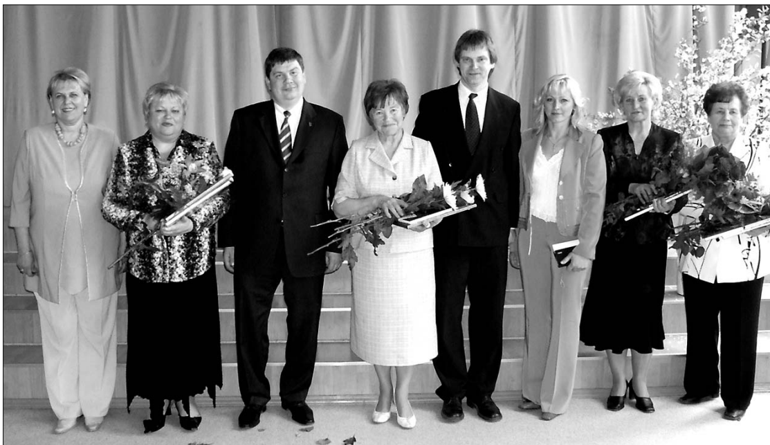
(No kreisās): Izglītības un zinātnes ministre Baiba Rivža, 2. vidusskolas skolotāja Natalja Kondratjeva, Ministru prezidents Aigars Kalvītis, Preiļu Valsts ģimnāzijas skolotāja Eleonora Bleive, Preiļu novada domes priekšsēdētājs Jānis Eglītis, 8.Saeimas deputāte Elita Šnepste, Aizkalnes pamatskolas direktore Mudrīte Vija Lozda un Preiļu 1.pamatskolas skolotāja Spulga Vilcāne.

19. maijā darba vizītē Preiļos apmeklēja LR Ministru prezidents Aigars Kalvītis. Ministru prezidents domē tikās ar priekšsēdētāju Jāni Eglīti un pārrunāja pašvaldībai aktuālus jautājumus.