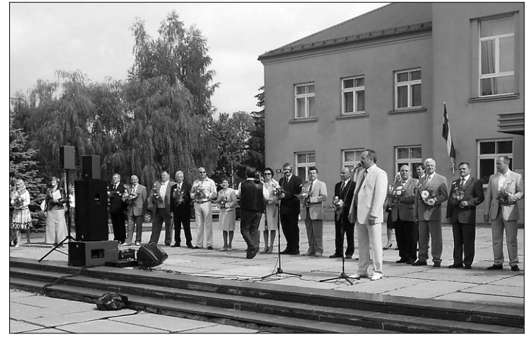
Руководители Латвийских молочно-перерабатывающих предприятий

На эстраде Прейльского парка выступала группа «Аутобусс дебесис», а председатель правления а/о «Прейлю сьерс» привлёк публику к участию в конкурсе