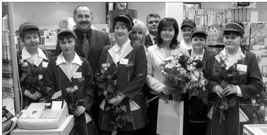
На открытии магазина «Preilis».

22 января в Прейли по улице Резекнес 13 открыл покупателям двери новый магазин дочернего предприятия а/о "Preiļu siers" ООО "Zolva". Магазин переехал из здания по ул. Резекнес 15 в просторные помещения, где удобно делать покупки преильчанам и гостям города. Здесь есть большой торговый зал, поэтому можно лучше осмотреть размещённую продукцию, ассортимент стал шире. В магазине работает 8 человек. Из них 6 были заняты уже ранее, а 2 рабочих места созданы заново.