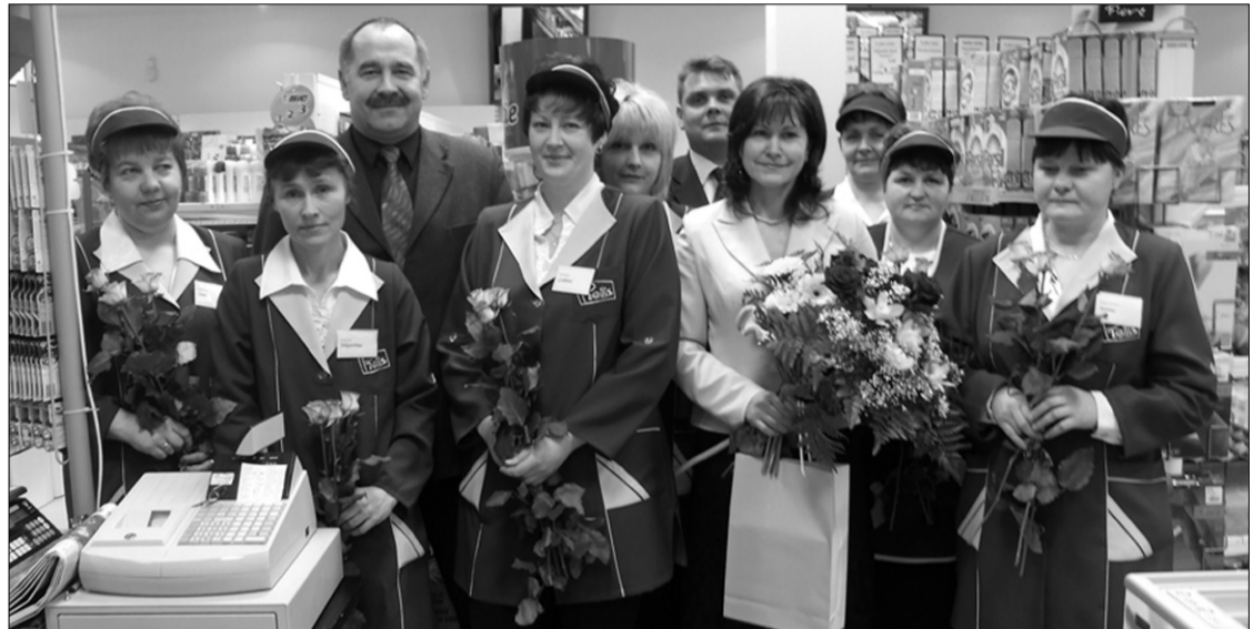
Veikals „Preilis” ieguvis jaunas un plašas telpas.

22. janvārī Preiļos, Rēzeknes ielā 13, pircējiem durvis vēra akciju sabiedrības „Preiļu siers” meitas uzņēmuma SIA „Zolva” jaunais veikals „Preilis”. Veikals ir pārcēlies no ēkas Rēzeknes ielā 15 uz plašām telpām, kur preiļiešiem un pilsētas viesiem būs ērtāk iepirkties. Te ir liela tirdzniecības zāle, līdz ar to labāk pārskatāma izvietotā produkcija, lielāka tās daudzveidība. Veikalā strādā astoņi darbinieki, no kuriem seši jau bija nodarbināti iepriekš, bet divas darba vietas ir radītas no jauna.