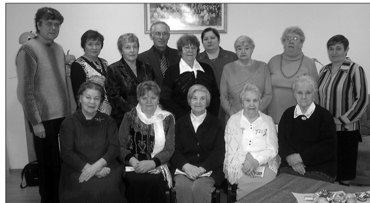
Славная и добрая традиция в Прейльской средней школе №2 - собрать в школе учителей-ветеранов хотя бы один раз в год. На сей раз тёплая предновогодняя встреча состоялась 28 декабря.