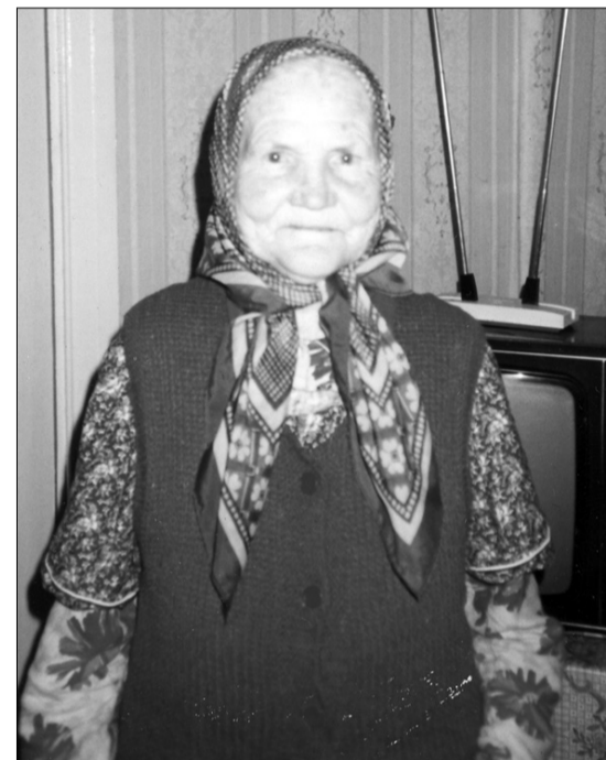
Фото из семейного альбома.

Приглашаем предприятия, учреждения и негосударственные организации Прейльского края выдвинуть на награждение Почвальными грамотами Прейльского края лица, которые внесли вклад в развитие города Прейли.