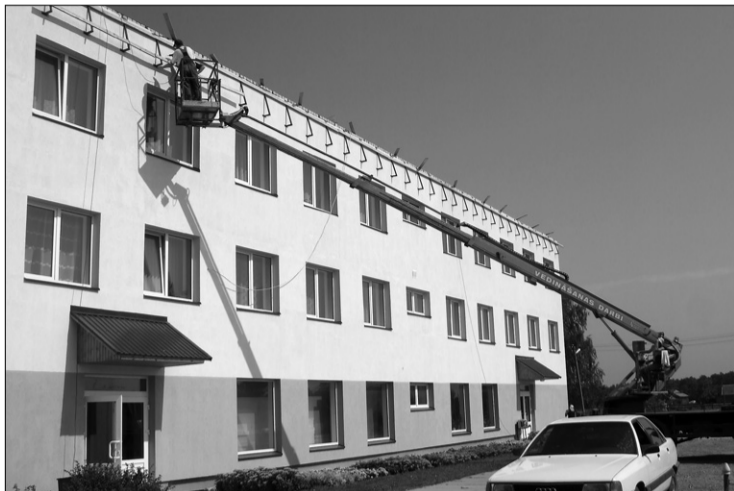
Sākusies Preiļu pagasta centra administratīvās ēkas jumta renovācija. Ēkas brīvās telpās nākotnē paredzēts izmantot iestāžu darbam.