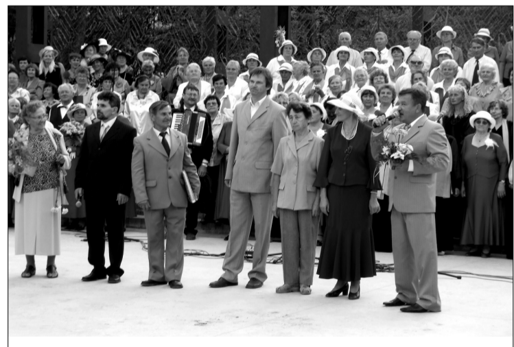
Svētku dalībnieku uzrunā Vladimirs Ivanovs (pirmais no labās puses)

Festivāla dalībniekus un viesus uzrunāja Valsts prezidents