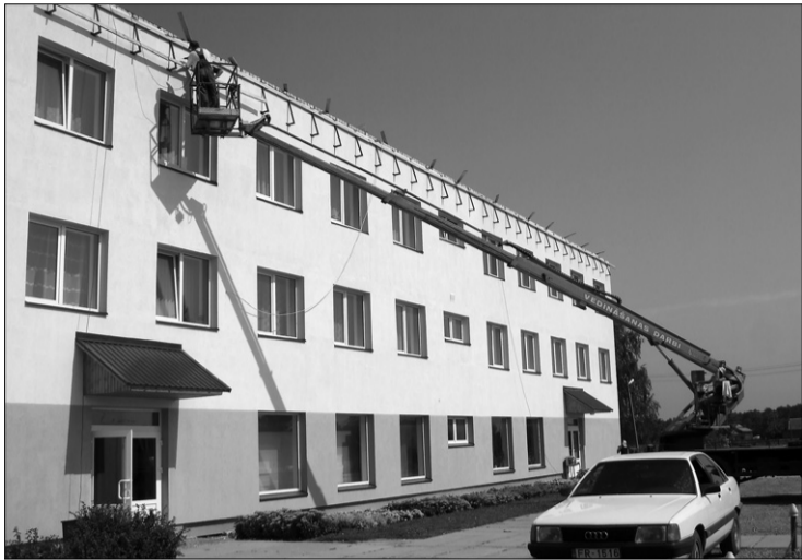
Началась реновация крыши административного здания Прейльской волости.