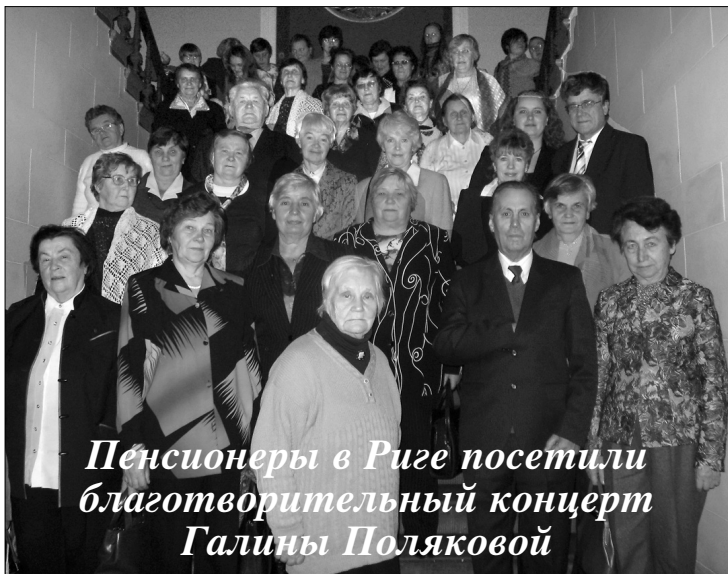
Пенсионеры в Риге посетили благотворительный концерт Галины Поляковой

На кануне дня Лячплесиса, 10 ноября, в Большом ауле Латвийского Университета состоялся благотворительный концерт Галины Поляковой организованный обществом поддержки вокальной культуры «Classic», чтобы полученные средства пожертвовать Дагдинскому пансионату престарелых людей и Елгавскому детскому дому.