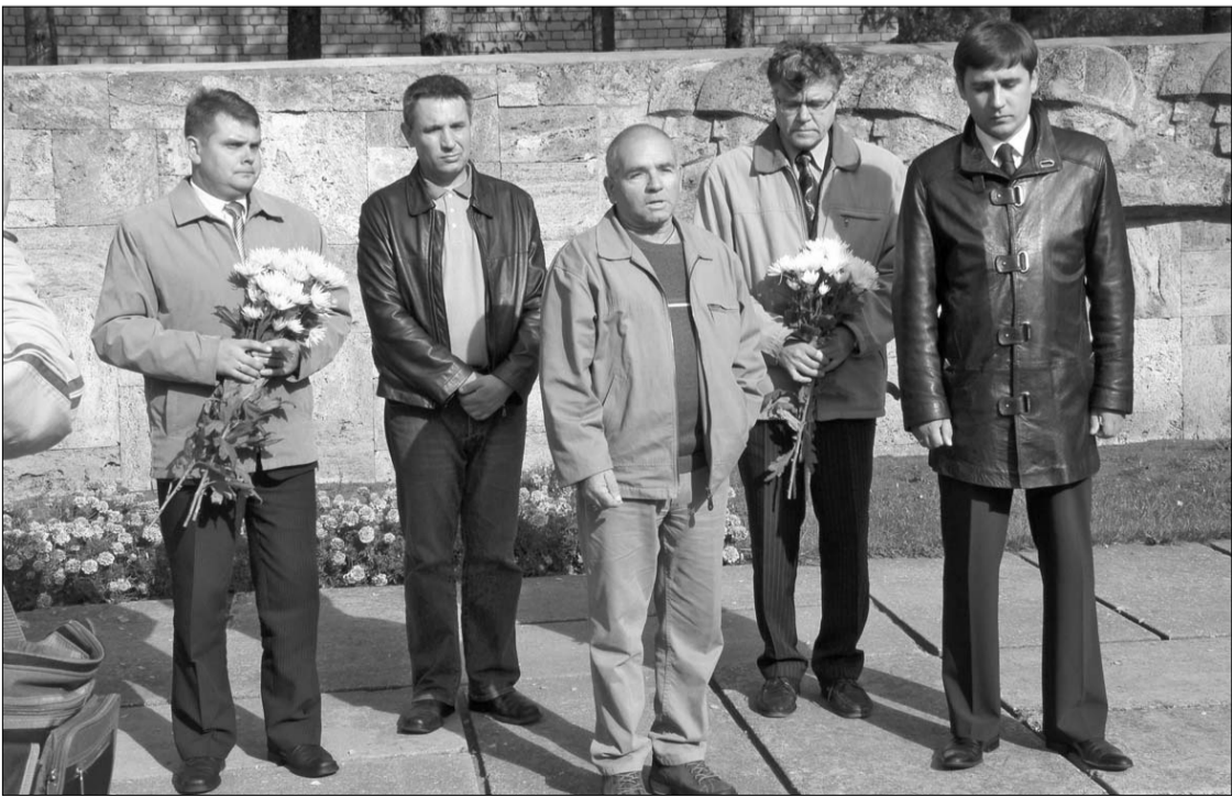
Informāciju sagatavoja Maija Paegle un Jānis Vaivods

Romāns Koršikovs, uzrunājot klātesošos, atzina, ka visi, kuri bija iesaistīti meklējumos, ir izdarījuši lielu un vajadzīgu darbu.