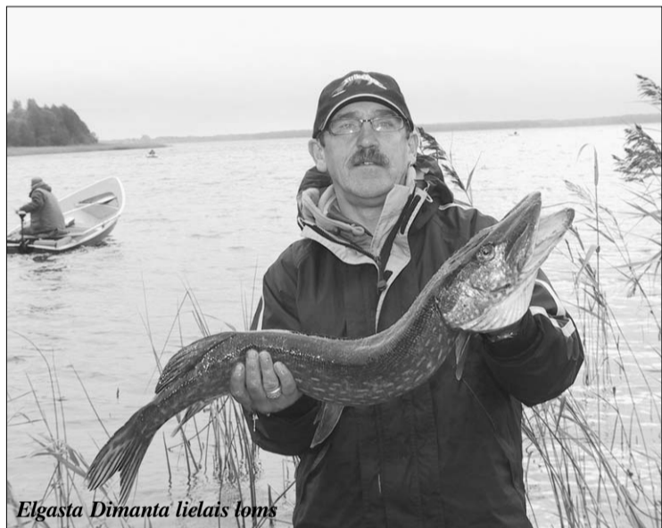
Elgasta Dimanta lielais loms

11. oktobrī Rušonas ezera krastā tika sadalītas balvas Latgales spinningošanas čempionāta uzvarētājiem. Noslēdzies sacensību 2. posms, kurā piedalījās 15 komandas. Sacensību noslēgums bija pulcējis izturīgākos no spinningotājiem, jo 1. kārtā, kas notika 7. jūnijā Feimaņu ezerā, par Latgales labāko spinningotāju komandas nosaukumu cīņījās 18 komandas.