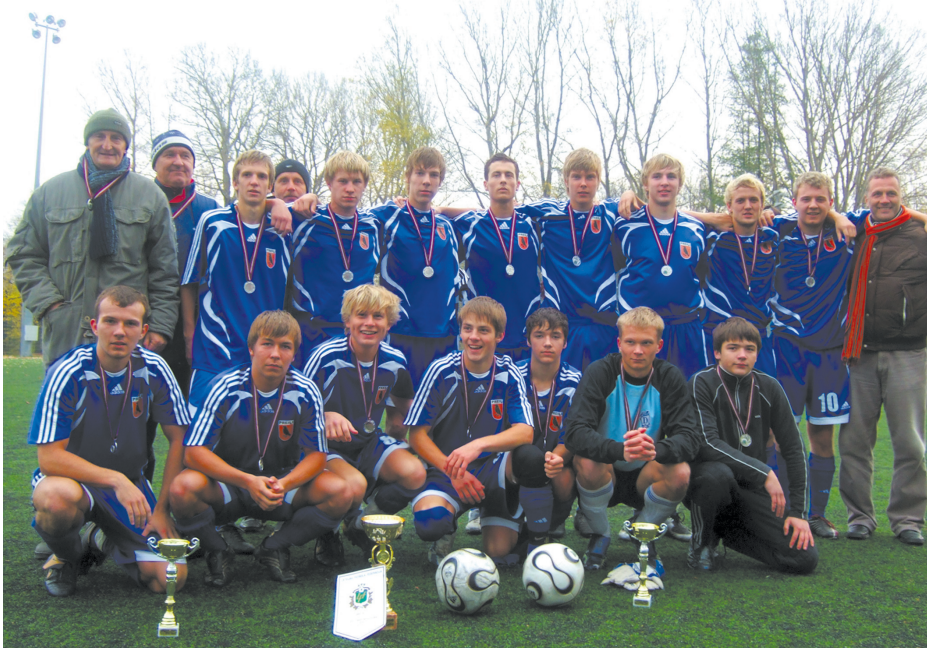
Preiļu futbolisti turpmāk spēlēs 1. līgā