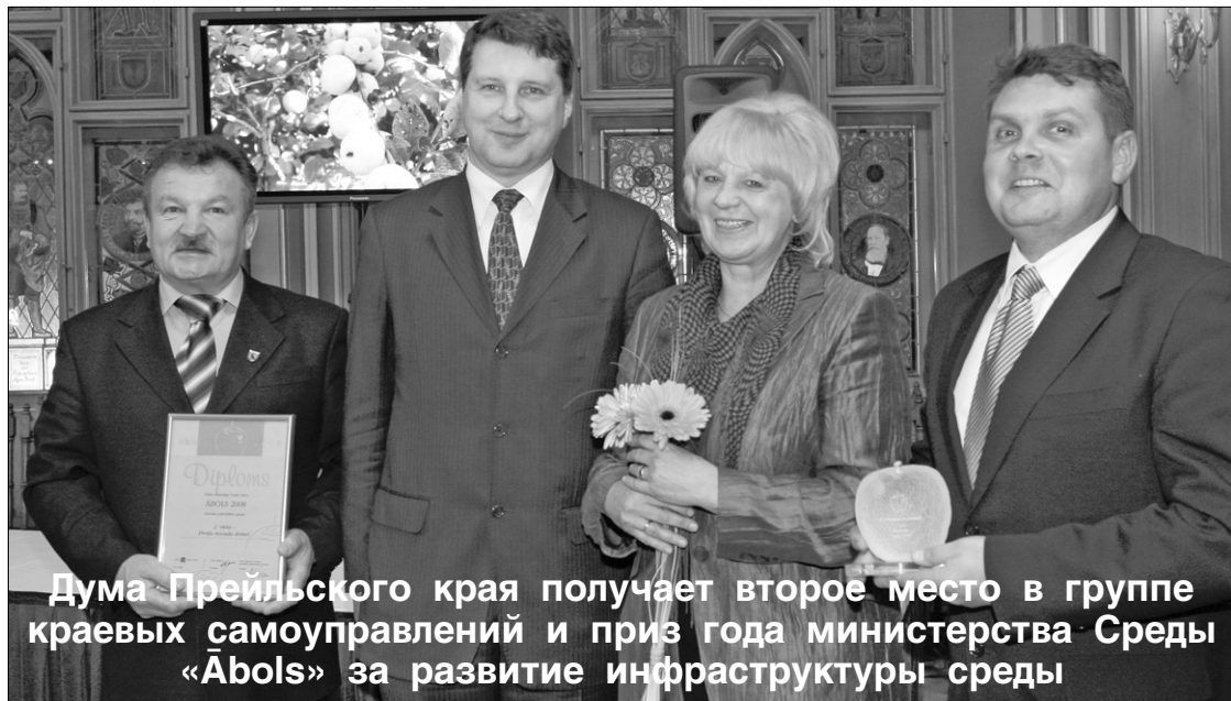
Дума Прейльского края получает второе место в группе краевых самоуправлений и приз года министерства Среды «Ābols» за развитие инфраструктуры среды

На мероприятии примет участие хор Учителей Прейльского района