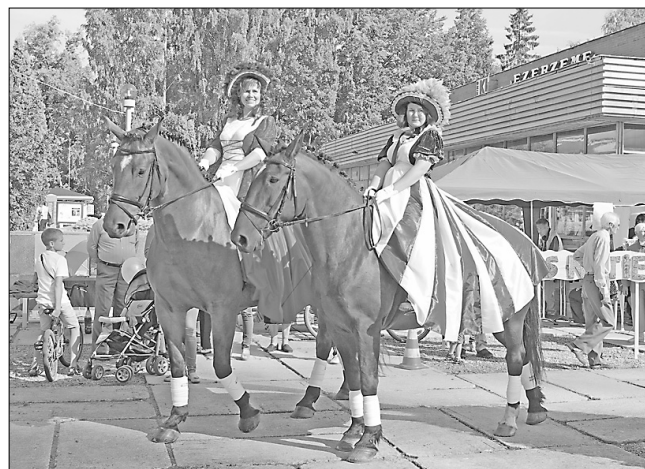
Svētku apmeklētājus priecēja grezni tērptas dāmas staltos zirgos

Vakarpusē svētki ar svētku uzrunām un bagātīgu muzikālo programmu turpinājās Preiļu parka estrādē. 15 iedzīvotājiem tika pasniegti Preiļu novada domes Atzinības raksti, kuri dažādās jomās ir devuši paliekošu ieguldījumu novada attīstī-