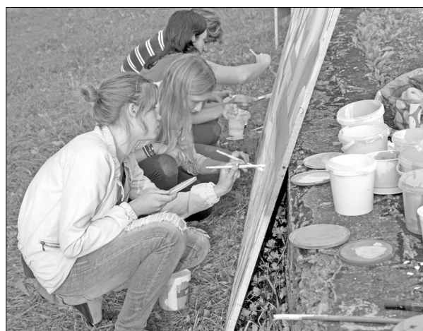
Radošās dienas «Raibie Preiļi» ietvaros tapa, jauniešu radīta, glezna Preiļiem