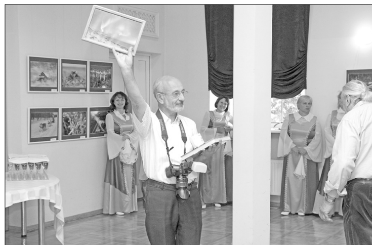
Fotogrāfs Igors Pličs – grāmatas «Latgale fotogrāfijās» idejas autors un veidotājs