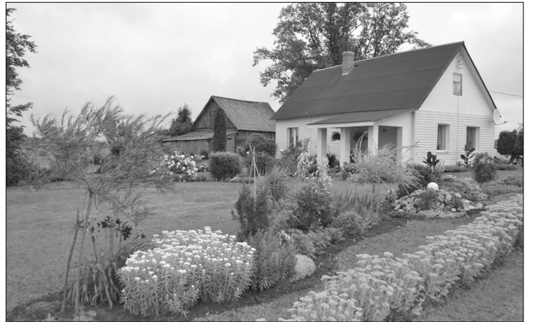
Saunas pagasta Ručevsku ģimene ar krāšņi ziedošo dārzu plūca laurus pagasta un novada konkursos