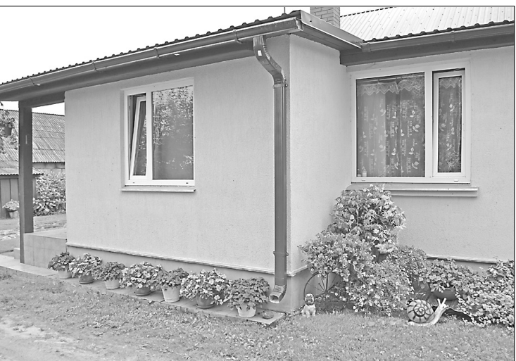
Balzamīnes un lilijas veido krāšņo rotu ap Liepu mājām