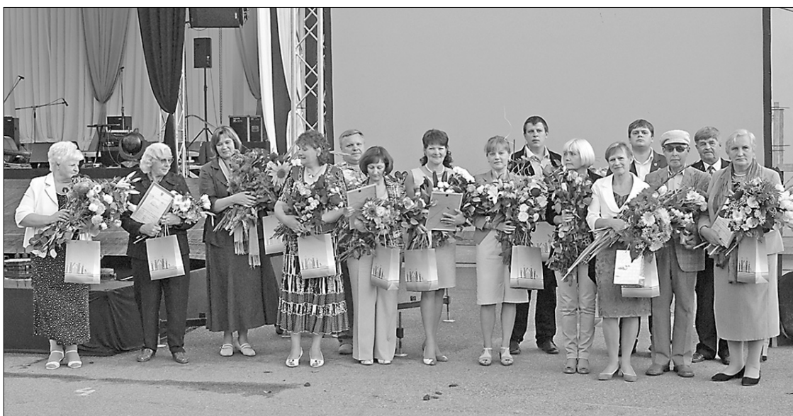
Piecpadsmit iedzīvotāji saņēma Preiļu novada Atzinības rakstus par ieguldījumu Preiļu novada attīstībā