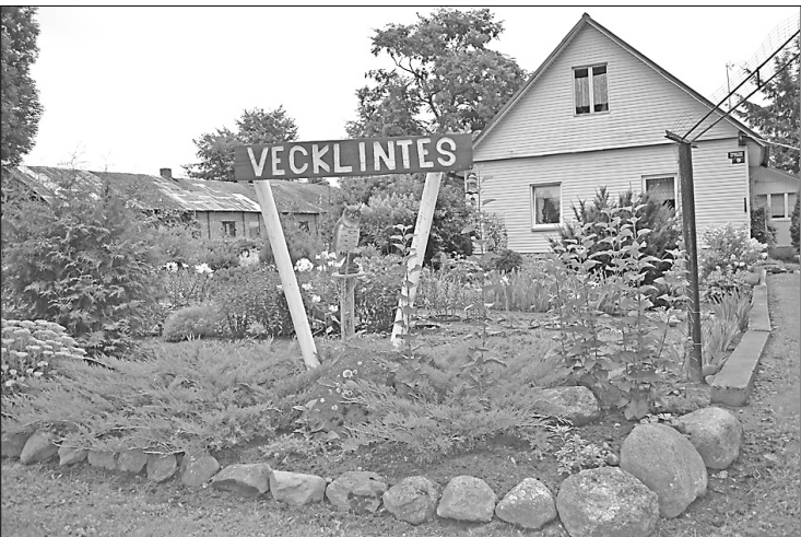
Vecklīntes – no pavasara līdz rudenim ziedos un zaļajos augos ieskaustas mājas