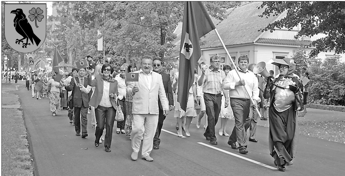
Svētku gājiens pa Raiņa bulvāri, sekojot Preiļu simbolam – Krauklim