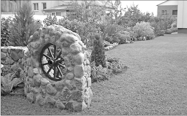
Saimnieku fantāzijas lidojums konkursa uzvarētāju - Elstu ģimenes - īpašumā Preiļu pilsētā

Grupā «Viensētas pagastu teritorijās» šogad bija pieteiktas septiņas sakoptas un gaumīgi iekārtotas