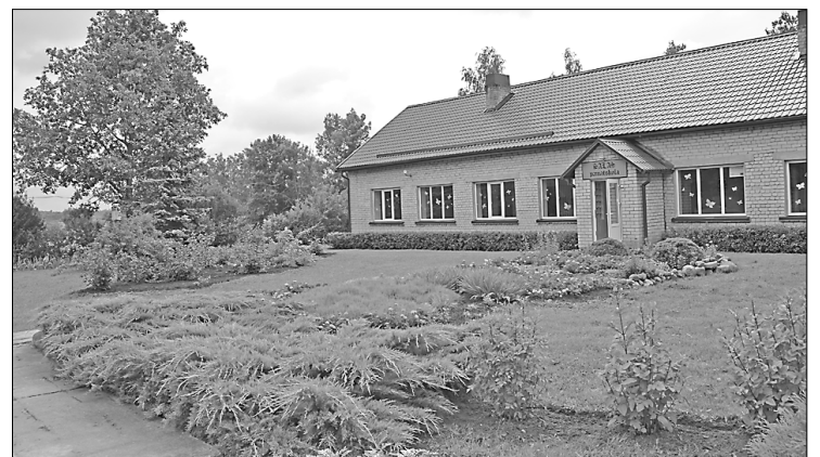
Salas pamatskolas apkārtnes labiekārtošanā ir pelicis roku ikviens audzēknis un skolas darbinieks