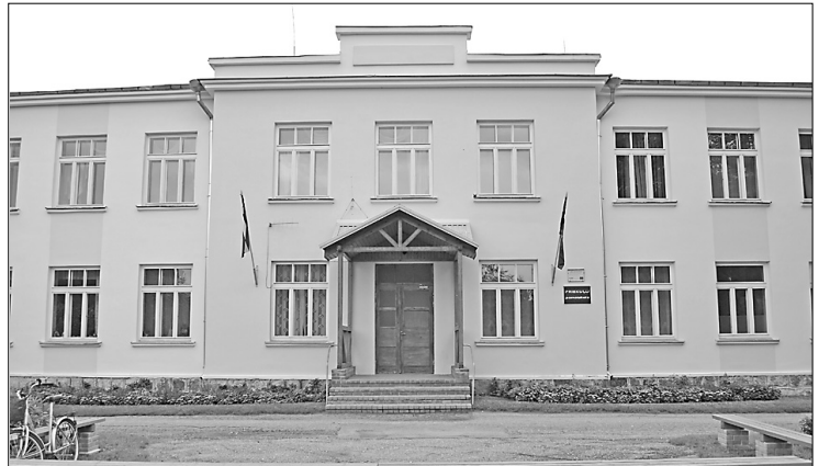
Priekuļu pamatskola priecē ar atjaunoto ēku, sporta laukumu un skaisto atpūtas stūrīti