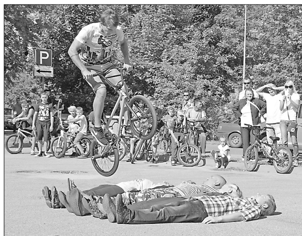
«Greentrials Bike Tour» ekstrēmo sporta veidu šovā pauraudemonstrējumos tika iesaistīti arī skatītāji