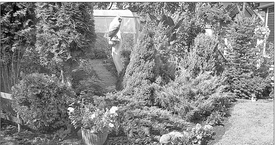
Elstu ģimenes īpašums Preiļu pilsētā