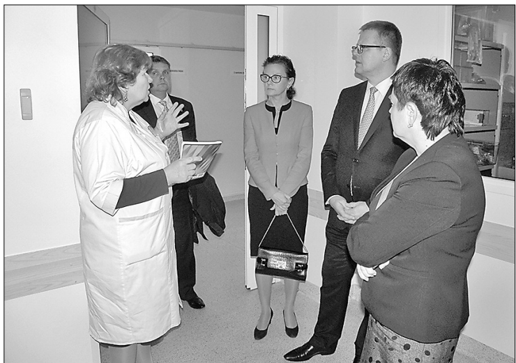
30. oktobrī Preiļus oficiālā vizītē apmeklēja Veselības ministrs Guntis Belēvičs kopā ar ministra biroja vadītāju Ingu Štāli.