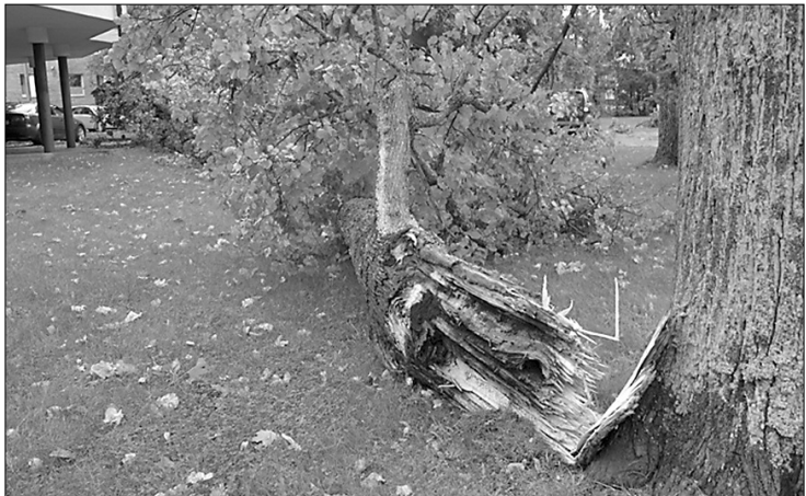
2016. gada augusta vētras postījumi Raiņa bulvārī, Preiļos

29. decembra domes sēdē Preiļu novada domes deputāti nolēma piešķirt papildu finansējumu 11307,65 eiro apmērā SIA «Preiļu saimnieks» bīstamo koku zāgēšanai un par papildus veiktajiem labiekārtošanas darbiem.