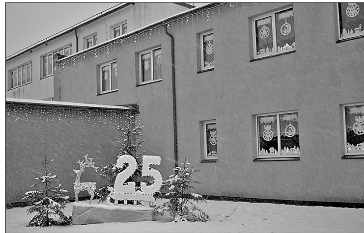
Pelēču pamatskolas noformējums

Īpaši par svētku noformējumu piedomā laukos, un tam apliecinājums ir tas, ka visas trīs pirmās vietas privātmāju kategorijā šogad piešķirtas lauku teritoriju īpašumiem – 1. vieta piešķirta īpašumam «Staburadze» Preiļu pagastā (īpašnieki Puzaku ģimene), 2. vieta –