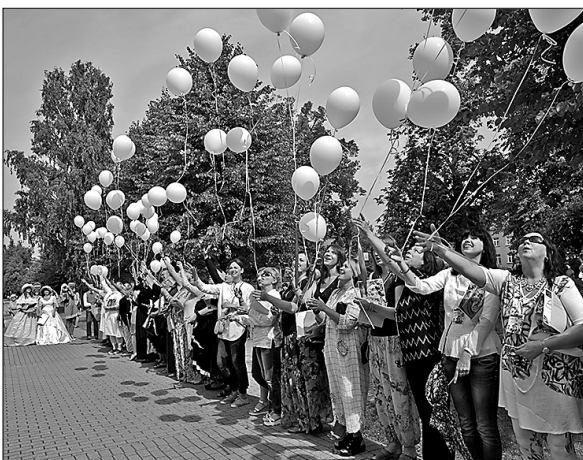
Leļļu festivāla atklāšanas salūts