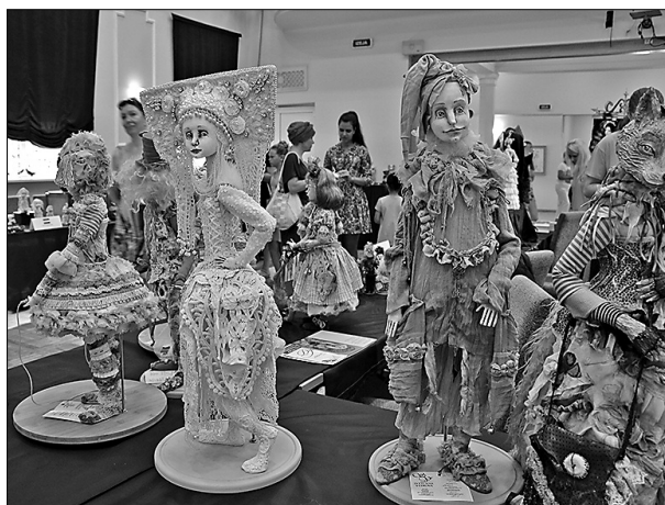
Autorleļļu izstāde Preiļu Kultūras namā