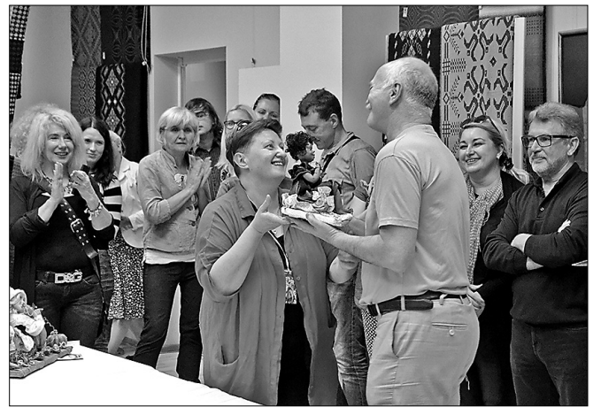
Leļļu meistarū piedāvāto darbu izloze

No 18. augusta līdz 20. augustam Preiļos norisinājās 3. Starptautiskais autorleļļu festivāls «Leļļu vasara Preiļos». Ar krāšņu festivāla atklāšanas pasākumu, leļļu izstādi Preiļu kultūras namā, izcilu mākslinieku piedāvāto darbu izlozi autorleļļu svētki bija krāšņi un piesaistīja īpaši lielu skaitu apmeklētāju.