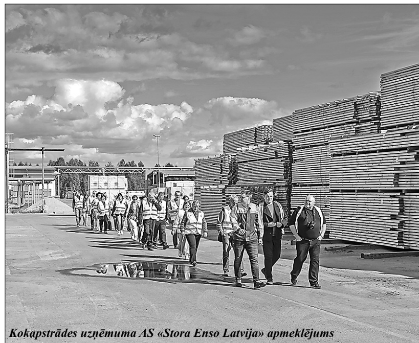
Kokapstrādes uzņēmuma AS «Stora Enso Latvija» apmeklējums

14. septembrī Smiltenes pilsētā un Smiltenes novada Launkalnes pagastā pulcējās 14 pašvaldību delegācijas no dažādām Latvijas malām uz 17. Latvijas Putnu pašvaldību – novadu, pilsētu un pagastu salidojumu.