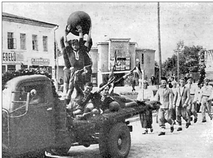
«Aizsargs» 1938. gada 15. septembrī – Preiļu futbolisti atklāšanas parādē Daugavpils ielās